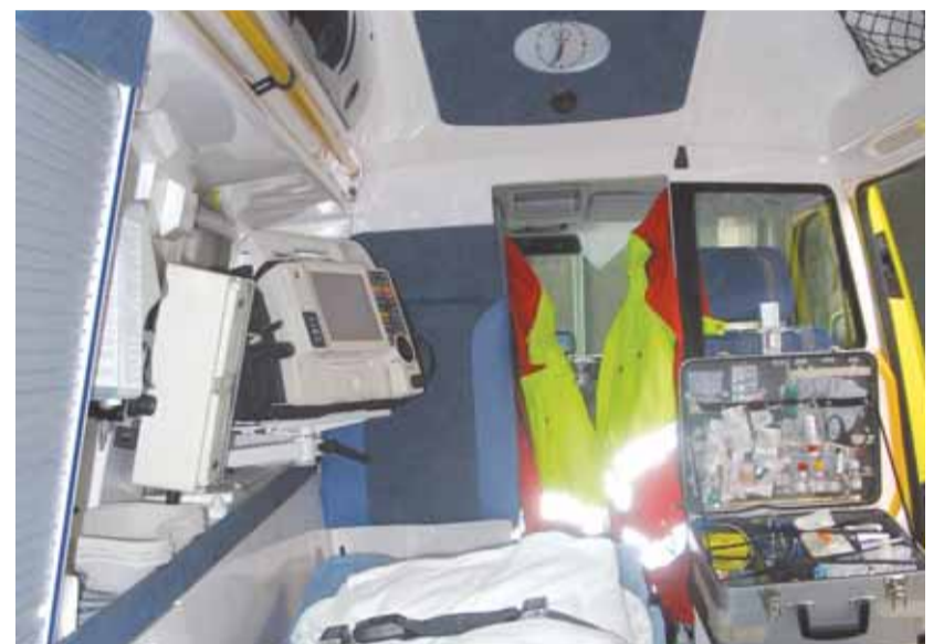
Näkymä ambulanssin sisätiloihin