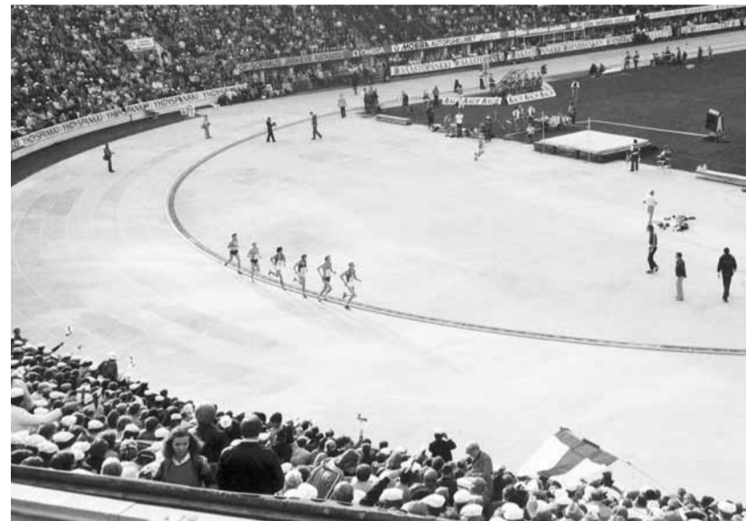
Jos edustusjoukkueella on ulkomailla mukana kotimainen lääkearsenaali kaikkeen mahdolliseen tarpeeseen, ei pitäisi olla vaaraa tahattomasta dopingista. Kuvamme edustaa yleisurheilumme "vanhaa hyvää aikaa" Suomi - Ruotsi maaottelusta Helsingin Olympiastadionilta vuodelta 1980. Tarkoituksena ei kuitenkaan ole yhdistää dopingin käyttöä erityisesti tuohon vuoteen, tai kyseiseen urheilutapahtumaan.

Kesän aikana saivat urheilusta kiinnostuneet jälleen kelpo annoksen arvokisaurmaa TV:n välityksellä. Talvella ovat taas katsottavissa uudet lajit. Kesällä suurimmat ja katsotuimmat tapahtumat (formuloita ei tässä yhteydessä käsitellä) olivat jalkapallon MM- ja yleisurheilun EM-koitokset. Kullakin osallistujamaalla on tuon tasoisissa kisoissa oma lääkärijohtoinen lääkintäjoukkueensa, tai ainakin lääkärisä. Koko kisa-tapahtuman yleisestä lääkintäorganisaatiosta vastaavat järjestäjät. Mo-