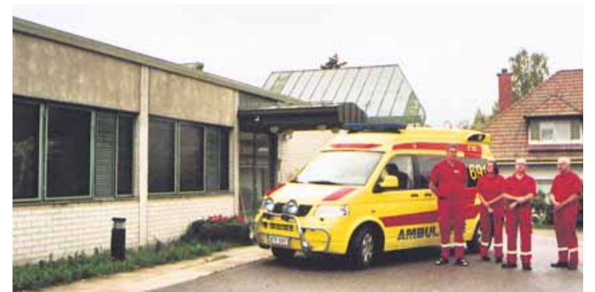
Parikkalan terveyskeskus on rakennettu ensimmäisten joukossa kansanterveyslain tultua voimaan. Sisätilat ovat asialliset ja ajanmukaiset. Ambulanssin ja miehistön taustalla vanha kunnanlääkärin talo, jossa aikoinaan sekä asuttiin että pidettiin vastaanottoa.