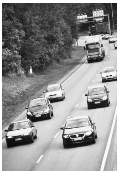
Normaali arkipäivän liikennetiheys Kehä I:llä. Ruuhka-aikoina ajetaan jonossa 20–30 km/h ja välillä jono seisoo. Kolareita esiintyy usein.

valvontaa kehittämällä olisi mahdollisuus vaikuttaa sekä yhteiskunnassa vallitseviin asenteisiin että suoranaisesti vähentää onnettomuuksien määrää.